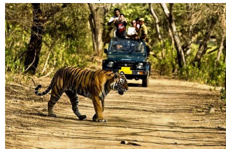
Национальный парк Панна