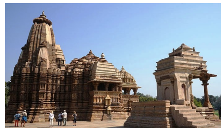
Храм Кандария Махадев